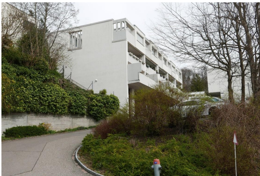
Siedlung «Haselsteig», Typ B / Reihe 3, Ansicht von SW, 21.03.2017 (Bild Nr. D101351_39).