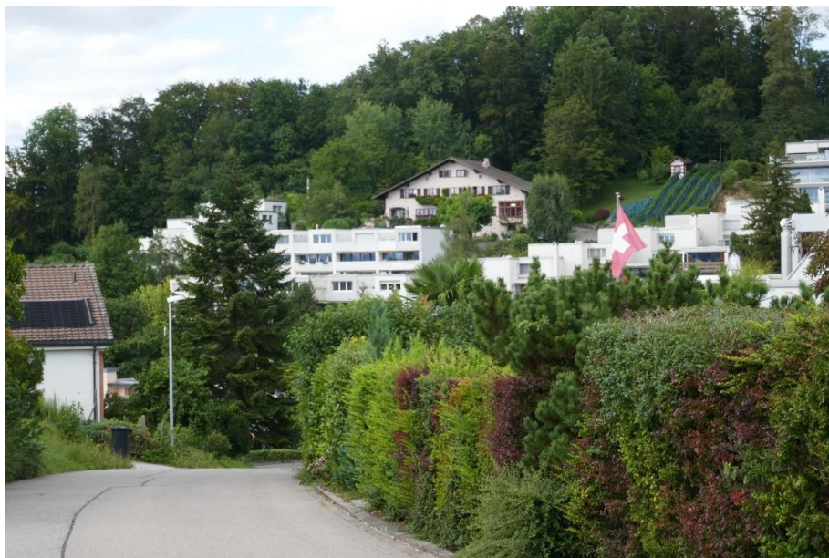
Siedlung «Haselsteig», Gesamtansicht von SO, 21.08.2019 (Bild Nr. D101351_32).

Bülach, Haselsteig 1, 2, 2a, 3, 4, 5, 6, 7, 7a, 8, 9, 10, 11, 12, 13, 14, 15, 16, 17, 18, 20 Siedlung «Haselsteig»