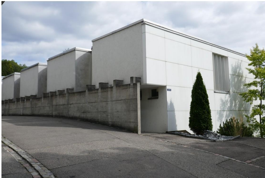
Siedlung «Haselsteig», Typ B / Reihe 4, Laubengang, Ansicht von NW, 21.08.2019 (Bild Nr. D101351_35).