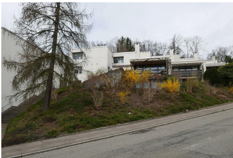
Siedlung «Haselsteig», Typ A / Reihe 2, Ansicht von S, 21.03.2017 (Bild Nr. D101351_34).